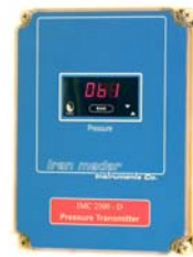
تابلوی دیجیتالی ( بدون دیتالاگر )