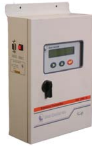
تابلوی میکروکنترلی ( دارای دیتالاگر )