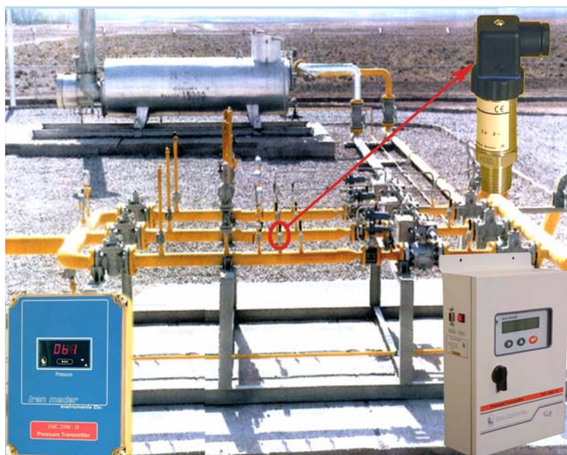
فشارسنج ترانسمیتری لوله ها